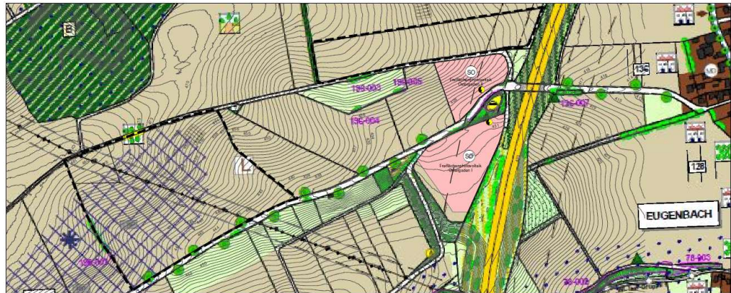
FNP/LP – Bestand

Im Zuge der Aufstellung des Bebauungsplanes mit Grünordnungsplan „Freiflächenphotovoltaikanlage Ostergaden III“ wird der rechtswirksame Flächennutzungsplan mit Landschaftsplan durch Deckblatt Nr. 17 im Parallelverfahren geändert und auf die angestrebte Planungssituation abgestimmt. Die Ausweisung erfolgt als Sonstiges Sondergebiet gemäß § 11 BauNVO mit der Zweckbestimmung Freiflächenphotovoltaikanlage.