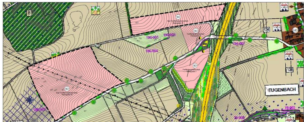
FNP/LP – Fortschreibung durch Deckblatt Nr. 17

Quelle: Rechtskräftiger FNP mit LP, Markt Altdorf; verändert KomPlan; Darstellungen nicht maßstäblich.